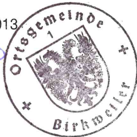
Bernd Flaxmeyer Ortsbürgermeister